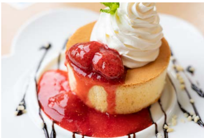
パンケーキ ¥550 いちご/キャラメル/チョコ