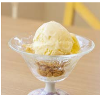
アイスクリーム ¥250 バニラ/チョコ/レモン/抹茶