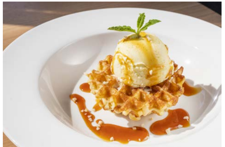
バターワッフル アイスのせ ¥550