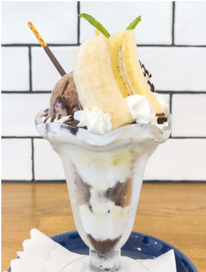
チョコバナナパフェ ¥650