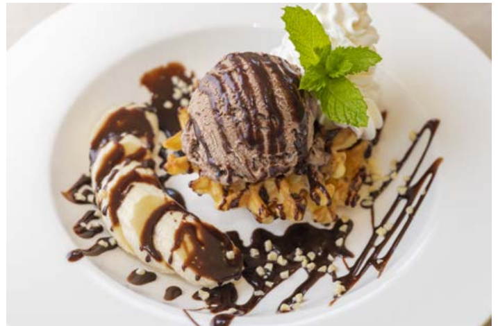
チョコバナナワッフル ¥600